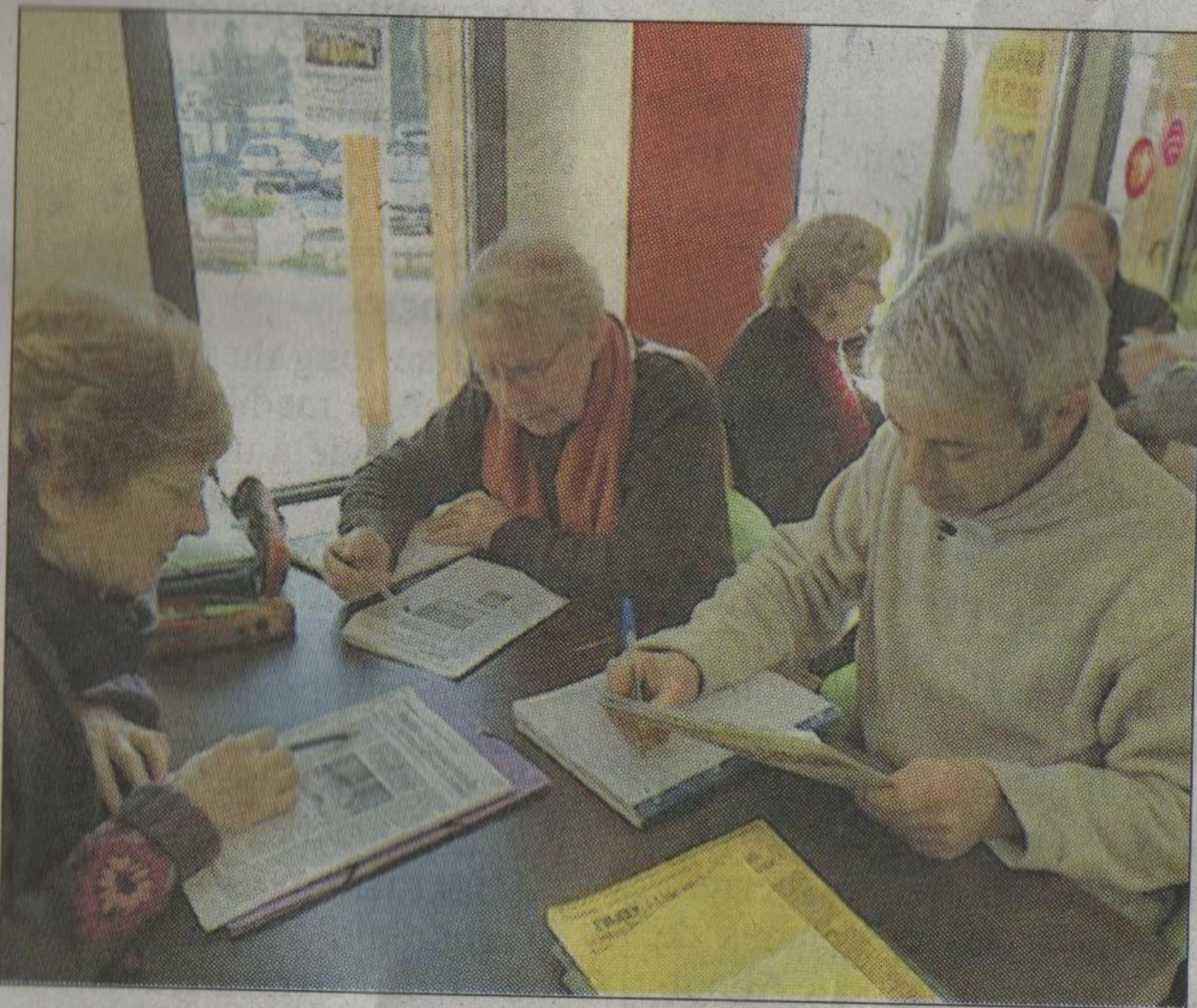
■ Par petits groupes les stagiaires du jour ont examiné les défis économiques pour 2014.

La leçon se poursuivra grâce au prochain atelier sur le thème : “un salaire à vie pour tous”, le samedi 1 er février à 15 h, toujours à la Biocoop. C'est gratuit et ouvert à tous. Infos sur le site : attac78nord.org .